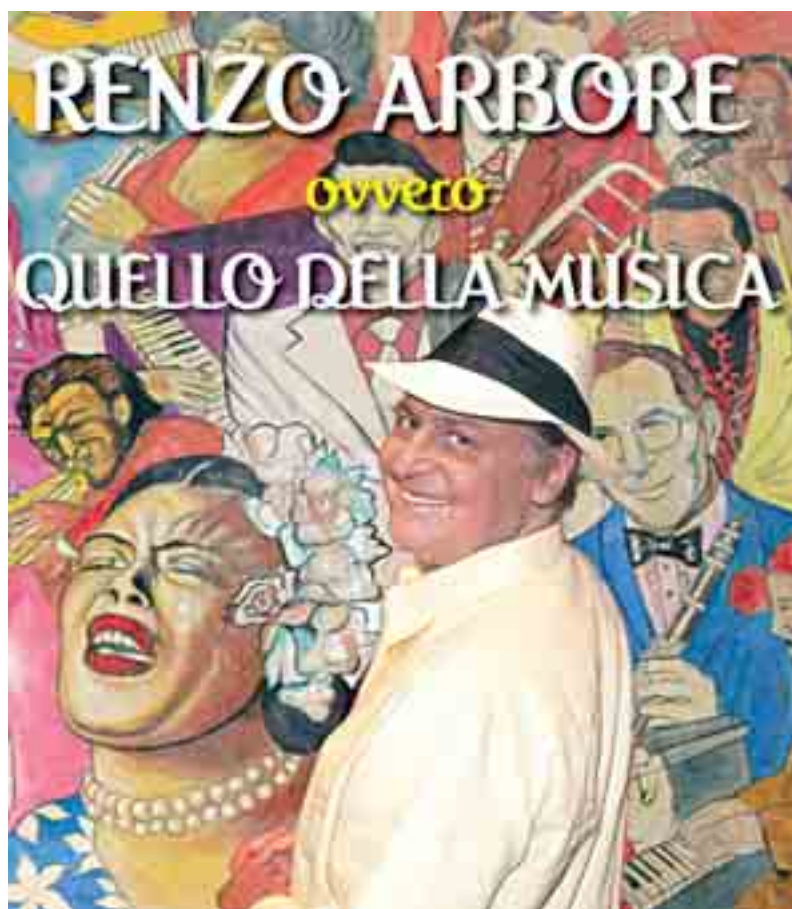
ARBORE SULLA COPERTINA DEL LIBRO

Un concerto antologico con gli hit più famosi e amati. Nei camerini, però, si litiga. Il trio guadagnerà oltre 150 milioni di euro